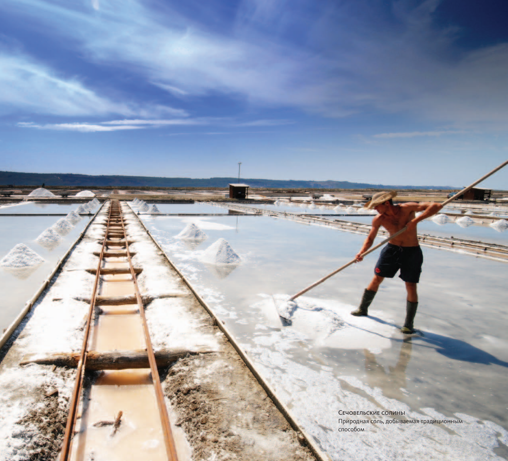
Сечовельские солины Природная соль, добываемая традиционным способом